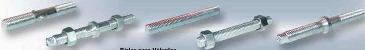
Birlos para Válvulas