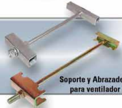
Soporte y Abrazadera para ventilador