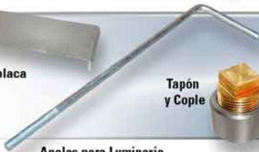
Anclas para Luminaria