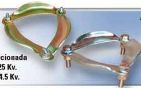
Brida Seccionada Clase 25 Kv. Clase 34.5 Kv.