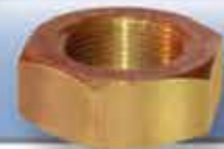
Tuerca genérica Latón