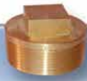
Tapón Macho 2"