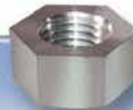
Tuerca genérica de acero inoxidable