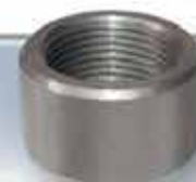
Medio cople de 1"