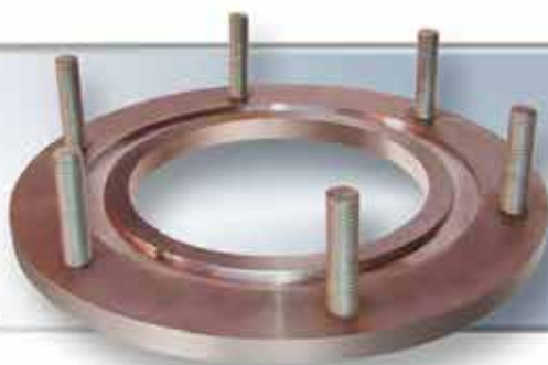
Brida para Válvula de sobrepresión