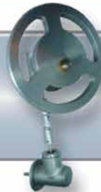
Asiento Volante Cambiador