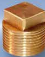
Tapón Macho 1"