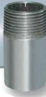
Niple de 1"