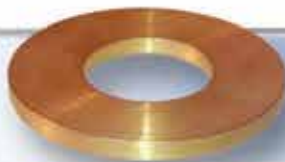
Rondana de Latón