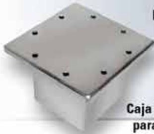
Brida Triangular tipo pozo